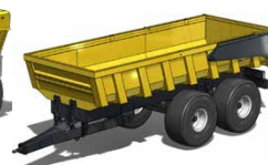
Remorques TP MASTER de 17 T à 32 T de PTAC