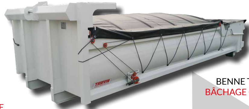
BENNE TP AVEC BÂCHAGE CRAMARO