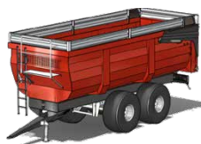
Remorques agricoles CORTAL de 14 T à 32 T de PTAC