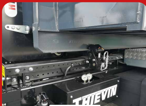
VERROUILLAGE AVANT DES CAISSONS