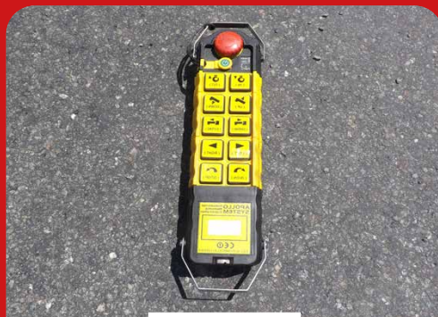
RADIO COMMANDE À LA PLACE DE LA BOÎTE À BOUTON FILAIRE

UNE DIVERSITÉ D'OPTIONS ADAPTÉES À VOS BESOINS