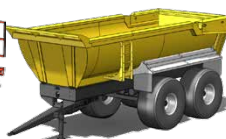
Remorques TP LEADER de 24 T à 32 T de PTAC