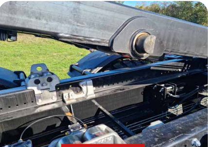
VERROUILLAGE DU CADRE DE BASCULEMENT AU CHÂSSIS