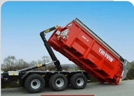
POTENCE COULISSANTE D'ORIGINE