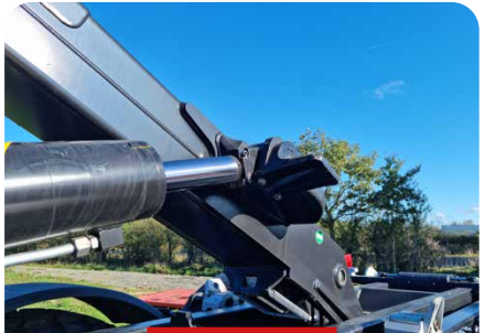
SUPPORT DE CAISSON SUR LE BASCULEUR