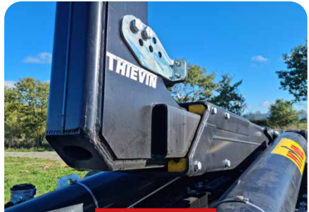
CALES EN POLYAMIDE ANTI-USURE