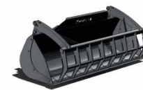
Accessoires pour chargeurs frontaux et télescopiques

THIEVIN LA QUALITÉ À LA HAUTEUR DE VOS EXIGENCES