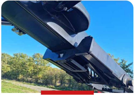
VERROUILLAGE PAR PÊNE EN POSITION OUVERT VERROUILLAGE DES 2 ÉLÉMENTS EN POSITION BENNAGE

QUALIFICATION UNITÉ ANTICIPATION LIENS INNOVATION TRAVAIL ÉCOUTE