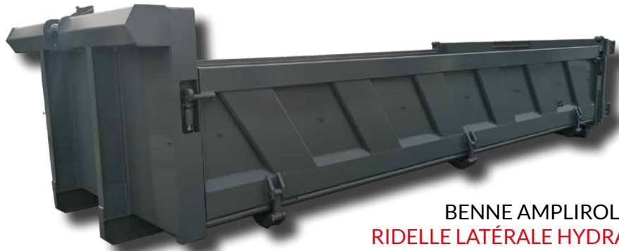
BENNE AMPLIROLL RIDELLE LATÉRALE HYDRAULIQUE