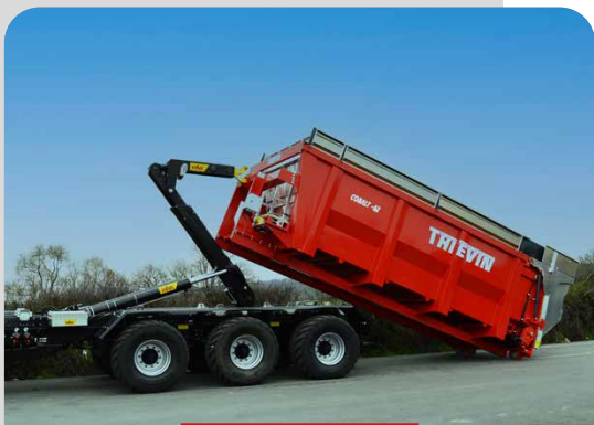
POTENCE COULISSANTE ET ARTICULÉE EN OPTION