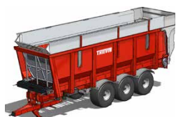
Remorques fond poussant-mouvant COBALT de 24 T à 32 T de PTAC