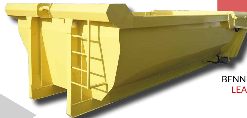
BENNE TYPE LEADER