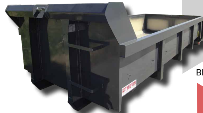
BENNE AMPLIROLL STANDARD