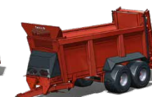
Epandeurs MARAL ST de 10,5 T à 29 T de PTAC