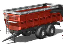
Remorques agricoles COBRA de 29 T à 32 T de PTAC