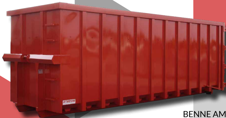
BENNE AMPLIROLL RENFORCÉ