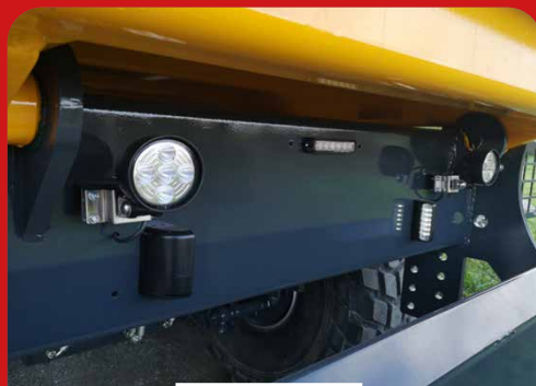
2 FEUX DE RECU