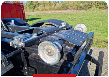
VERROUILLAGE HYDRAULIQUE DU CAISSON ET ROULEAUX ARRIÈRE DEMI-ARBRE