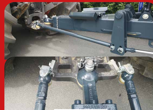
ESSIEUX SUIVEURS FORCÉS