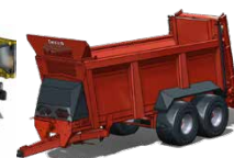
Epandeurs MARAL PRO de 11,4 T à 29 T de PTAC