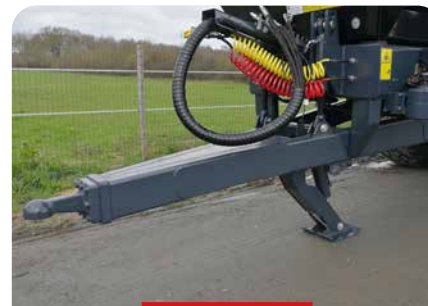
FLÈCHE À SUSPENSION HYDRAULIQUE AVEC CALOTTE K80