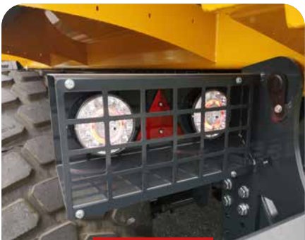
DOUBLE FEUX À LED