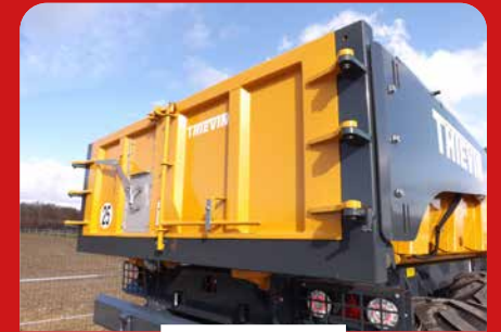
PORTE ARRIÈRE HYDRAULIQUE 2 BATTANTS