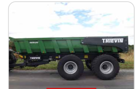
PEINTURE DE CAISSE SPÉCIALE