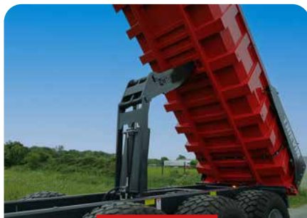
COMPAS DE BENNAGE BASSE PRESSION DOUBLE EFFET