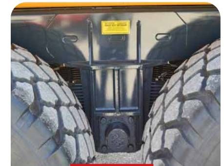
BOGGIE RENFORCÉ SPÉCIAL TP SUR 180 ET 210