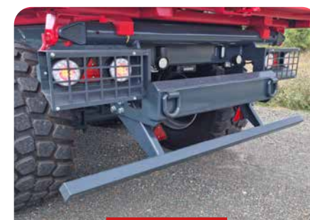
BARRE DE POUSSÉE ARRIÈRE ET BAE