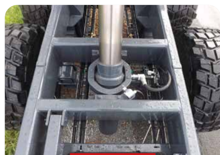
VÉRIN ROTULE ET BERCEAU