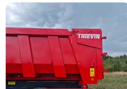
BRAS DE PORTE INTÉGRÉ DANS LA CAISSE