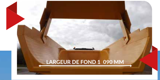
LARGEUR DE FOND 1 090 MM