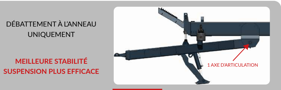
FLÈCHE À SUSPENSION HYDRAULIQUE

Q UALIFICATION U NITÉ A NTICIPATION L IENS I NNOVATION T RAVAIL É COÛTE