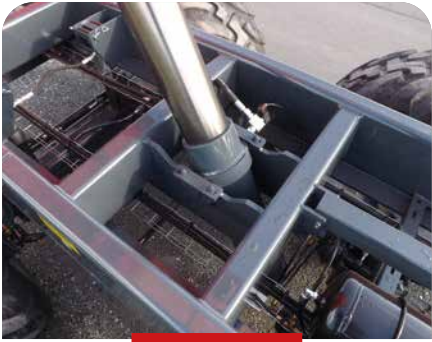
LARGEUR CHASSIS 1 160 MM