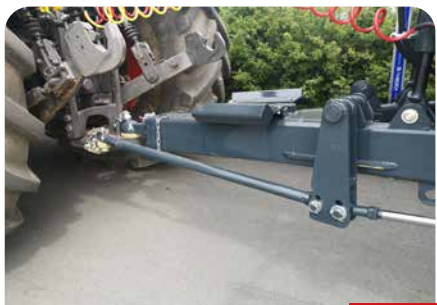
ESSIEUX SUIVEURS FORCÉS