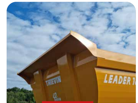
CASQUETTE SUR FACE AVANT