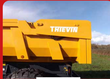
PORTE ARRIÈRE HYDRAULIQUE MONOBLOC TYPE LEADER (1DE)