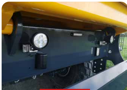
2 FEUX DE RECUIL À COMMANDE MANUELLE