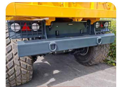
PARE CHOC DE POUSSÉE AVEC 2 ANNEAUX DE TIR