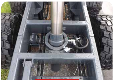
VÉRIN AVEC ROTULE ET BERCEAU