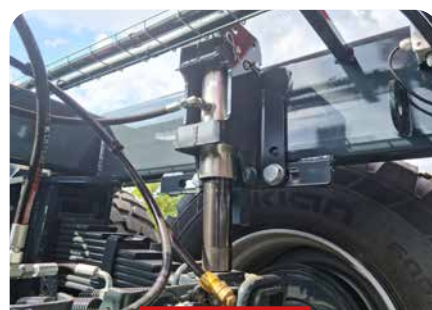
REPORT DE CHARGE AVANT BENNAGE