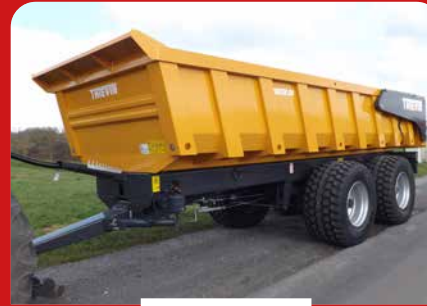
HAUTEUR DE CAISSE 1000 MM