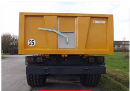
TRAPPE À GRAIN INOX